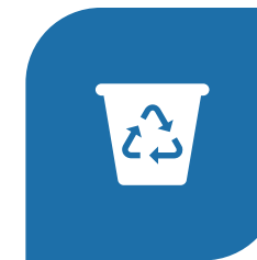
RESILIENT CITIES (WATER, WASTE, CIRCULAR ECONOMY, MOBILITY)