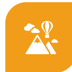
SMART & SUSTAINABLE TOURISM